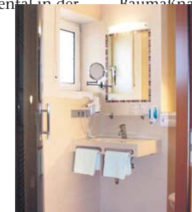
Die Badezimmer sind neu.

Im September 2009 wurden die ersten Planungsentwürfe mit dem Kulmbacher Objekteinrichter Jürgen Bodenschlägel auf das Papier gebracht. Ziel war es, die 19 Gästezimmer, von Grund auf zu modernisieren. Angefangen von neuen Bodenbelägen, Wand- und Deckensanierung, über neue Möblierung und wirtschaftlicher Beleuchtungstechnik, bis hin zu neuen Badezimmern wurde alles geplant. Flachbildfernseher, DSL-Internetzugang für jedes Zimmer